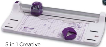
5 in 1 Creative A4