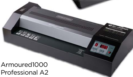
Armoured1000 Professional A2

To find out more information on the full range of products, visit us at www.snopakebrands.com