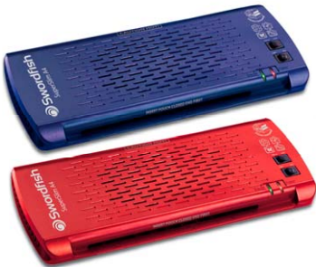
SuperSlim Series A4