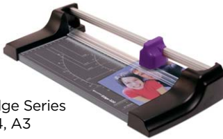
Edge Series A4, A3