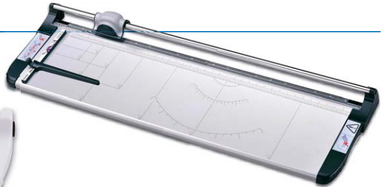
Elite Series A3, A2