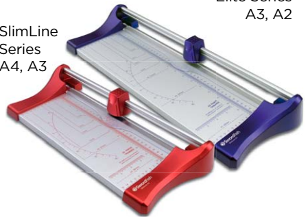
SlimLine Series A4, A3