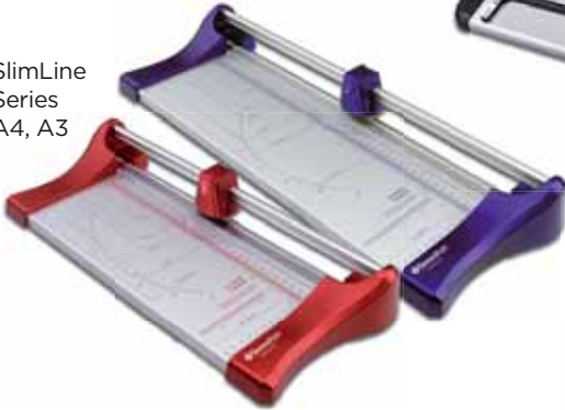
SlimLine Series A4, A3