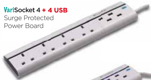
VariSocket 4 + 4 USB Surge Protected Power Board