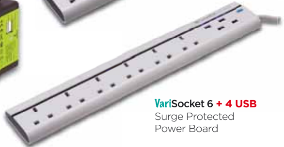
VariSocket 6 + 4 USB Surge Protected Power Board