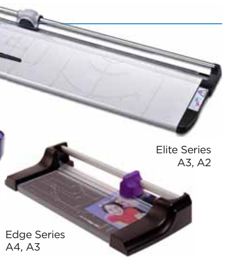
Edge Series A4, A3