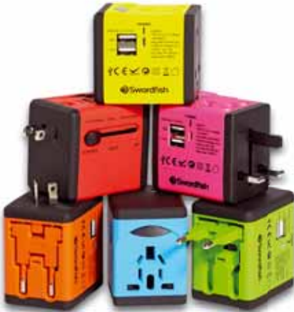
VariPlug Dual USB Universal Travel Adapter